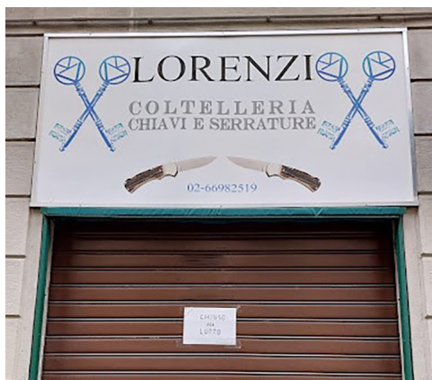
Negozi Giovanni Lorenzi