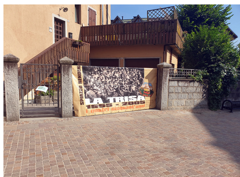
NOI al “4th July” di Pinzolo