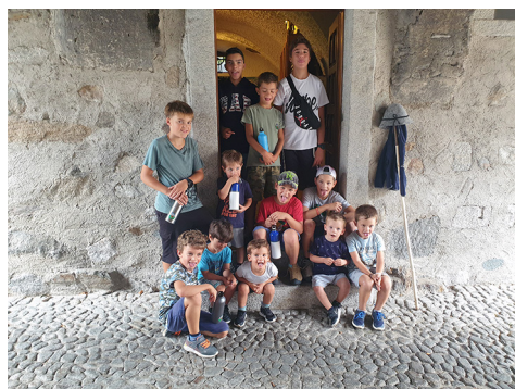
I Pòpi da La Trisa